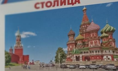
Москва, Красная площадь

Столица - это главный город страны. Столица России - Москва. За долгие истории нашей родины столицами бывали также Великий Новгород, Киев, Владимир и Санкт-Петербург.