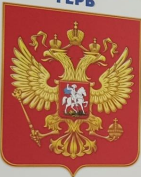
Герб Российской Федерации

Герб страны - это особая, неповторимая эмблема. В России история герба связана с печатями великих князей, а потом и русских царей. Этими печатями скреплялись важные документы. На печатях обычно было имя владельца и изображение его святого покровителя.