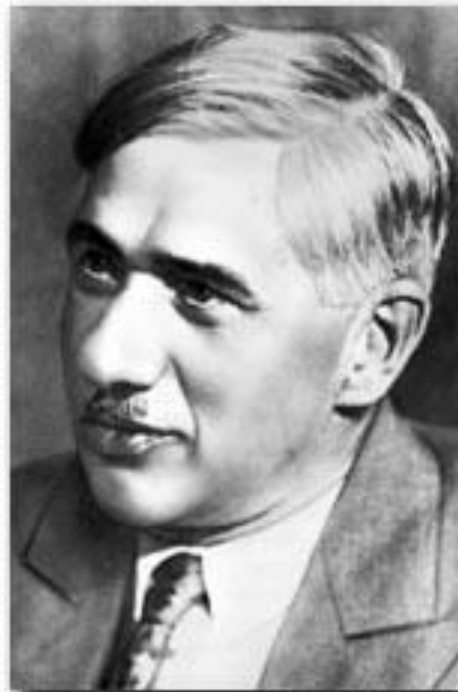
К. И. Чуковский