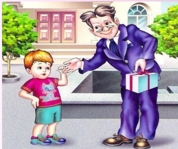
«Разговор с незнакомым»