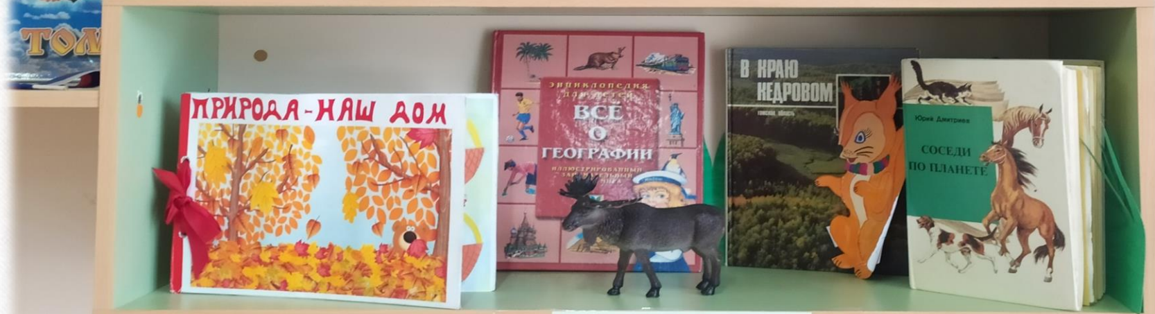
ДИКИЕ ЖИВОТНЫЕ РОДНОГО КРАЯ