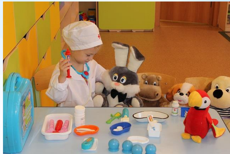
Игра «ВЕТЕРИНАРНАЯ ПОЛИКЛИНИКА»