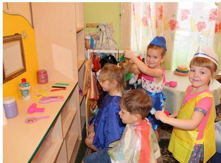
Игра «САЛОН КРАСОТЫ»